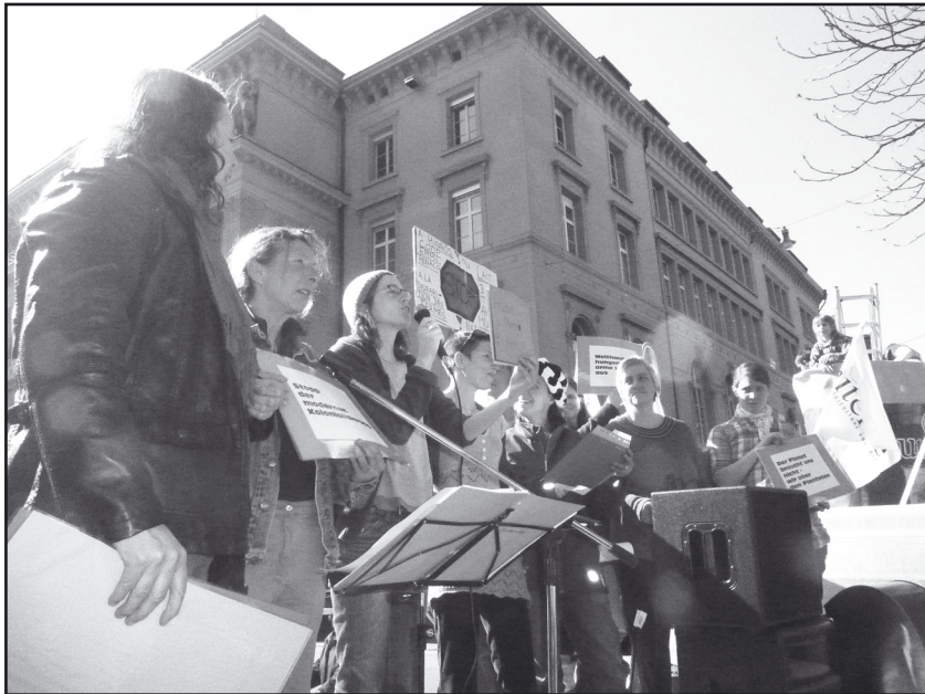
Les femmes d'Uniterre lors d'une manifestation en 2012 sur la place fédérale.

Les femmes de Via Campesina et Uniterre s'engagent pour la souveraineté alimentaire, partout dans le monde. Nous soutenons les mouvements populaires pour la souveraineté alimentaire car il est important de s'opposer à la politique néolibérale des gouvernements et de faire émerger des solutions porteuses d'avenir.