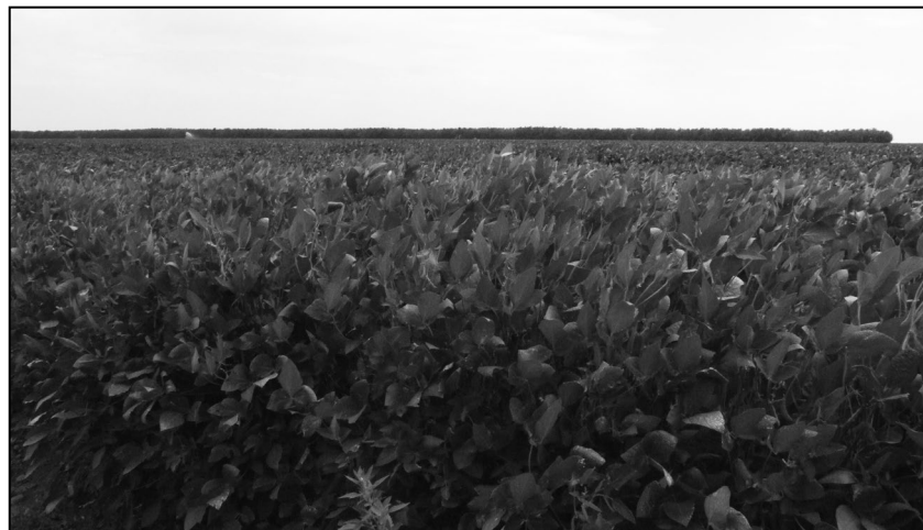
Soja conventionnel Braila county dans le sud-est de la Roumanie

La plateforme s'engage à ce que la culture du soja soit mieux prise en compte dans le cadre du futur programme européen (avec un focus particulier sur la réforme de 2014). Elle souhaite établir des lignes directrices pour la production sans OGM et pour l'utilisation des produits phytosanitaires dans cette région. Les principaux arguments avancés en faveur de ce projet sont qu'il offre la sécurité aux consommateurs quant à l'absence d'OGM, qu'il participe à l'approvisionnement de l'Europe, qu'il contribue à l'intégration de la région du Danube dans l'Union en offrant des opportunités économiques à ces pays et permet aux entreprises qui veulent répondre à la demande en denrées alimentaires et fourrages libres d'OGM d'avoir un avantage comparatif par rapport à