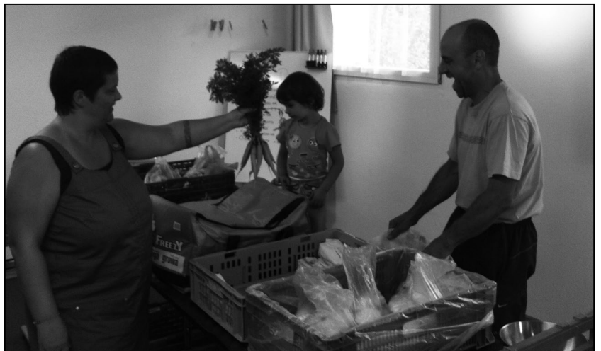
Distribution de paniers de l'Association croQu'Terre

Temps Présent à la RTS Emission du 16 janvier 2014 Un reportage de Pascal Rebetez et Bertrand Theubet. Image: Didier Charton. Son: Beat Lambert. Montage: Jean-Michel Laubli.