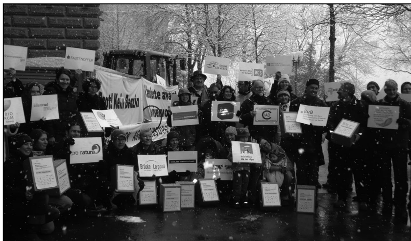
Dépôt d'une pétition contre les agrocarburants en 2011 (60 000 signatures). Uniterre et Swissaid étaient impliqués.

Ruedi Rechsteiner est économiste, conseiller national de 1995 à 2010 et l'un des pères de la Rétribution à prix coûtant (RPC) du courant injecté. Il est président de Swissaid depuis 2008 et vit à Bâle.