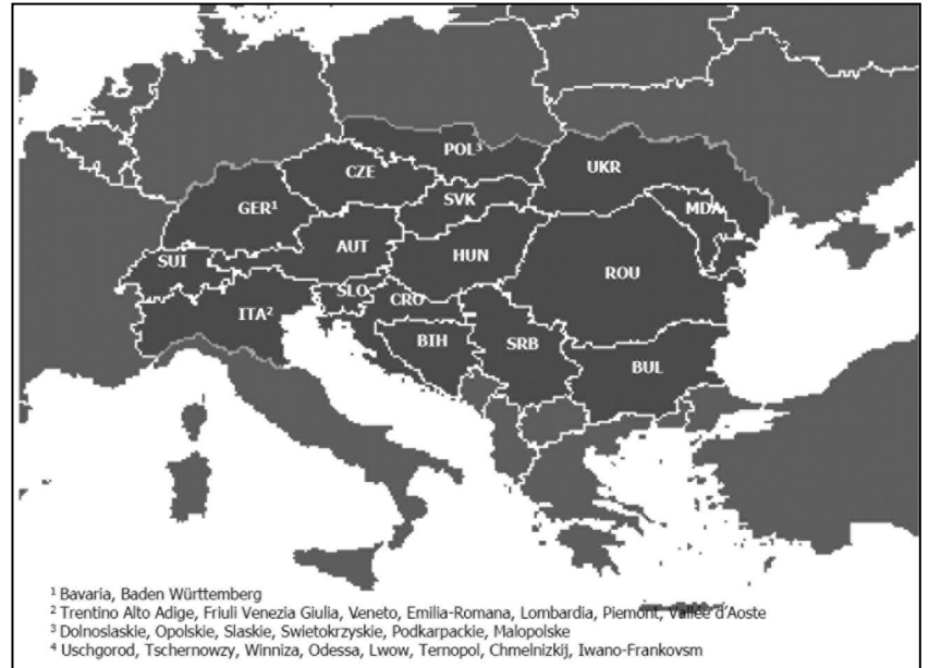
Carte du soja.

Thèmes: relance des productions fourragères en Suisse, mise en place d'une plateforme nationale, filière pain équitable.