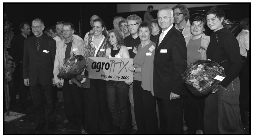
Attribution du prix du jury d'une valeur de 20'000 francs.

Par ailleurs, dans le cadre du lien direct entre ville et campagne, nous serons une force pro active pour encourager les collectivités publiques à prioriser la production locale dans leurs achats (crèches, écoles, cantines, hôpitaux, EMS etc.).