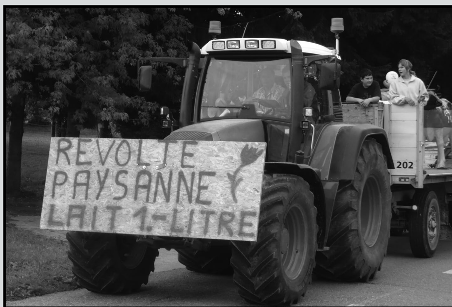
L'ensemble de la Suisse romande a pris part à la révolte, comme ici, à la Chaux-de-Fonds.

Lorsqu'au début des années 1990, Uniterre a fait partie des membres fondateurs de la Coordination paysanne européenne (devenue Coordination Européenne Via Campesina), c'est parce que votre syndicat avait saisi que tout ne pouvait se résoudre au plan national. Qu'ici comme ailleurs, nous vivons des problématiques similaires et qu'unis nous sommes plus forts! Il y