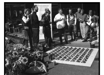
Jardins du Flon à Lausanne.

Uniterre cherchera aussi, dans le cadre des consultations lors de changements législatifs, à renforcer le positionnement et la reconnaissance des projets d'agriculture contractuelle de proximité comme des activités agricoles à part entière pouvant donner droit à des crédits, des