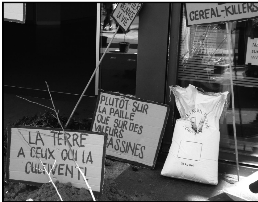
Un 17 avril à Genève, réaction paysanne au sauvetage de l'UBS...

que grâce au système politico-économique de libre-échange; presque une croyance, un dogme que certains brandissent fièrement, dont notre Ministère de l'économie. L'objectif est celui de faire circuler les marchandises tant que cela peut rapporter de l'argent à quelques intermédiaires. A coup de subventions à l'exportation (lait, céréales etc.) et à coup de réduction des tarifs douaniers.